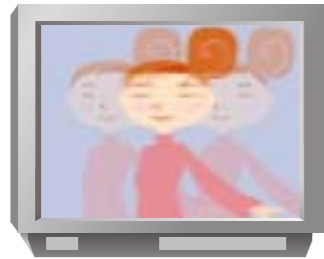
地上アナログ放送