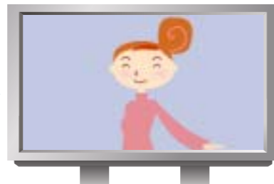
地上デジタル放送