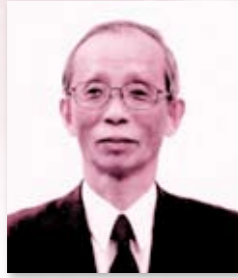
香芝市長 梅田善久

本市は交通の利便性と緑豊かな自然環境により、良好な住宅都市として発展してきましたが、少子高齢化の進展や経済低迷による雇用問題の深刻化、税収の低下など取り巻く環境は厳しさを増しており、そのような中で地方分権のさらなる進展もあり、本市自らの判断と責任によるまちづくりを行うことが必要となっています。