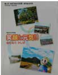
第4次香芝市総合計画

〔市長〕誰もが住み良い町にする、学校を良くする、子育てを応援する、市役所を良くする、市民が決めるという5つの柱と、第5次香芝市総合計画をうまく結びつけたいと考えている。