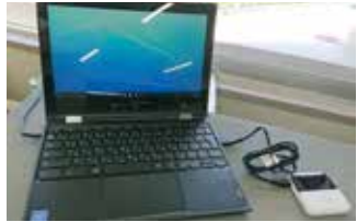
オンライン学習用のパソコンとモバイルルーター

〔問〕長期休業によって健康面学習面で子どもへの負担が心配だが、学校現場の対応はどうか。