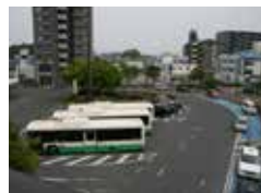
近鉄五位堂駅北側ロータリー

〔問〕五位堂駅を中心とした地域に待機児童が多いが、駅前分園を作り本園までバス等で運行することについてはどう考えているのか。