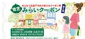
香芝みらいクーポン(第2弾) 9月1日から使用できる

〔市長〕市内の商工業が発展しなければ、本市の発展を見込むことはできない。市内の商工業を支援し、発展することにより香芝の魅力が上がりと考えている。