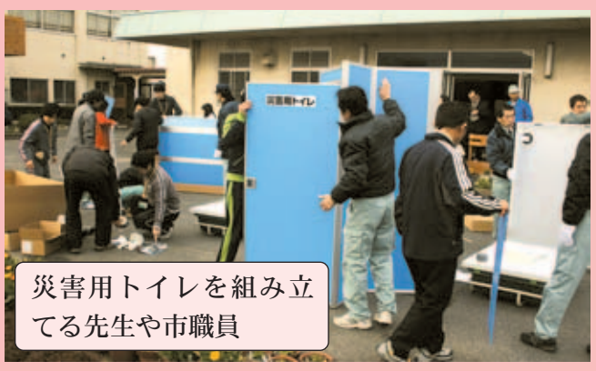
災害用トイレを組み立てる先生や市職員