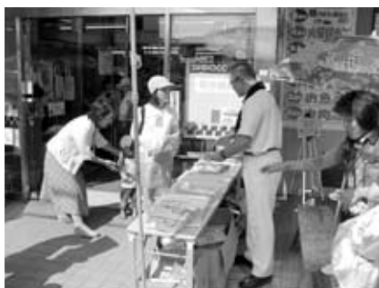
▲市内スーパーでのエコキャンペーン

〔副市長〕マイバッグの普及は、限りある資源を有効的に使う手法であることから、運動を市内全域に広げていきたい。