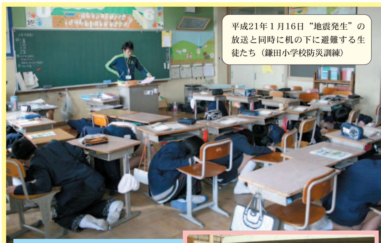
平成21年1月16日“地震発生”の放送と同時に机の下に避難する生徒たち（鎌田小学校防災訓練）

発行：香芝市議会 編集：香芝市議会だより編集委員会 連絡先：〒639-0292 香芝市本町1397 香芝市議会事務局 ☎76-200(代)