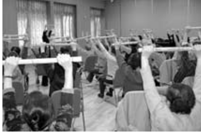
▲転倒骨折予防教室

認知症予防教室や水浴訓練、筋力向上トレーニング等の各種教室を開催している。また、民生委員等が高齢者を定期的に訪問し、介護状態や認知症の早期発見を心がけている。