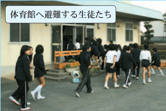
体育館へ避難する生徒たち