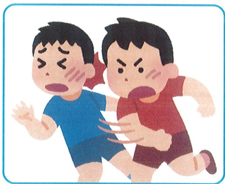
ケンカや暴力行為による負傷