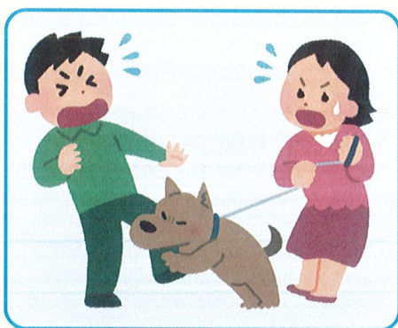
他人のペットによる負傷