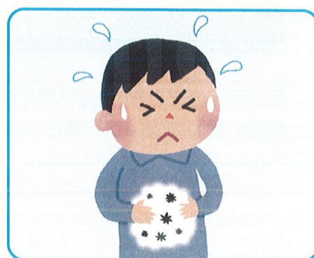
購入品や飲食店などでの食中毒