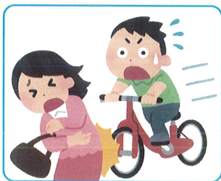
自転車による事故