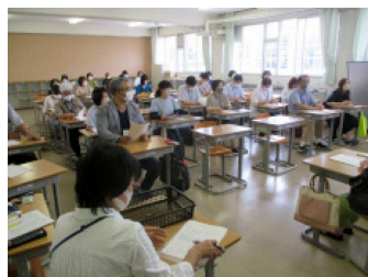
<昨年度の写真です>

にも、まずは校内においてのあいさつを徹底できたらなって思います。だから絶対にスルーはやめようよ。