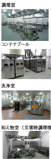
広陵町・香芝市共同中学校給食センター『スマイル』 厨房設備

広陵町・香芝市の中学校給食約3,600食分を作っており、調理・配送・配膳員合わせて約60名の方が働いています。調理場内は、県内でも珍しい連続炊飯機がある炊飯室をはじめ、焼物・揚物・蒸物室・和え物室・煮炊き調理室・アレルギー食調理室にわかれています。衛生管理基準に従い、安全・安心な給食を提供します。