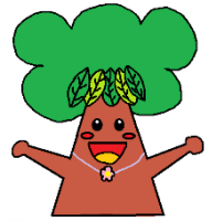
鎌小マスコットキャラクター くすのき