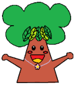
鎌田マスコットキャラクター くすのつき m.m