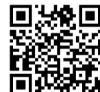
香芝市 教育委員会HP