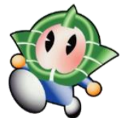
香芝市イメージキャラクター カッシー