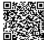
広陵町 教育委員会HP