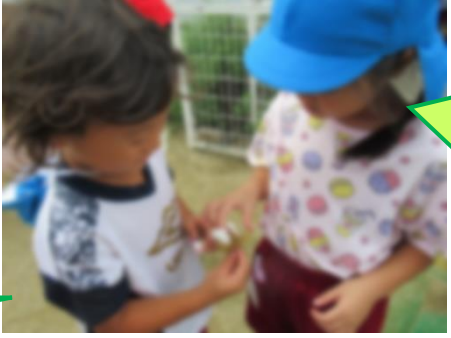
ほんまや! フワフワしてる