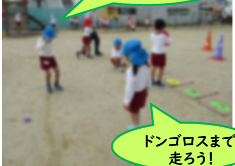
ドンゴロスまで 走ろう!