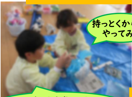
持っとくから やってみよう