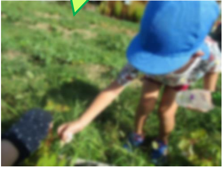
気持ちいい!触って!!