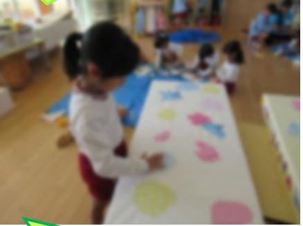
可愛くしたらみんな喜ぶかな?