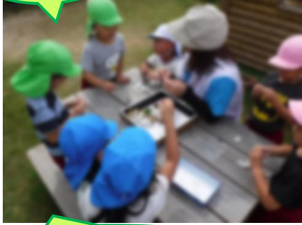
綿の中から種でてきた!!