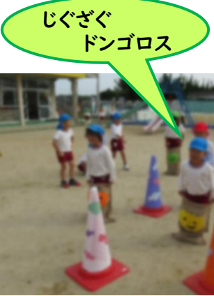
じぐざぐ ドンゴロス

運動会後も、園庭では運動会ごっこが繰り返されています。そんな中、年中・年少さんに、「バトンもらったら走るねんで!」「ここ持ったら跳べるよ」等、ルールや仕方を教える姿が見られます。また自分たちでコーンを並べてリレーの準備をしたり、新たなルールを考えたりして遊びを発展させながら楽しんでいます。