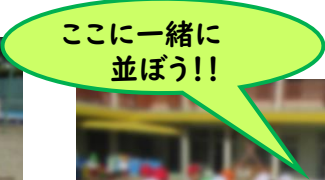
ここに一緒に 並ぼう!!