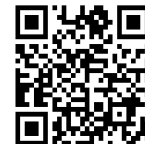
香芝市 教育委員会HP