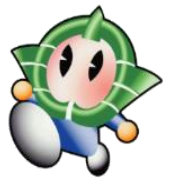
香芝市イメージキャラクター カッシー