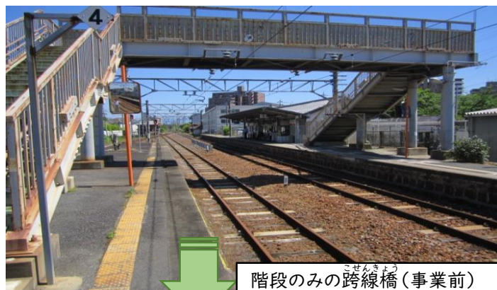
階段のみの跨線橋(事業前)