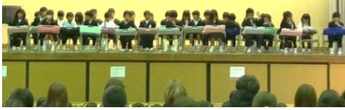
2年生 いのちの学習 「ぼくらはみんな生きている」