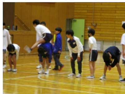
男子バスケットボール