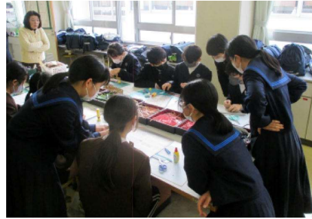
ホームメイキング