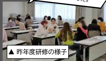
▲ 昨年度研修の様子