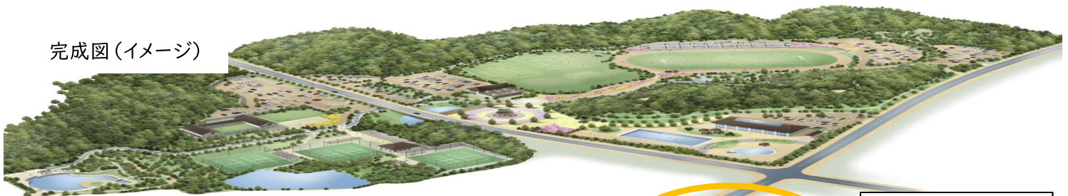
プール施設予定地