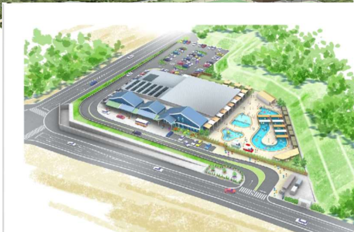
プール施設完成図 (パース)