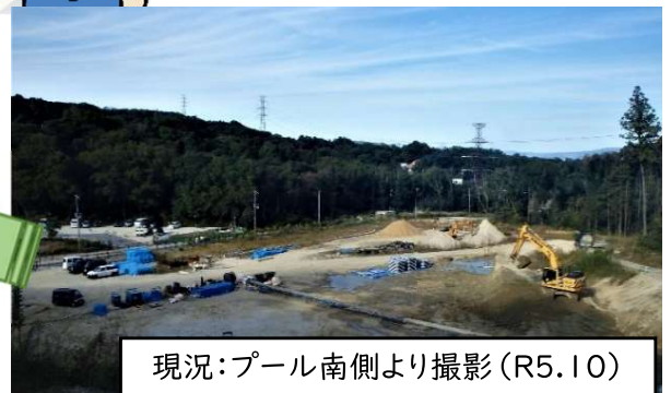
現況：プール南側より撮影 (R5.10)