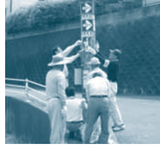
撤去作業のようす

市では、道路上の電柱やガードレールなどに違法に取り付けられた立看板・はり紙を、違反簡易広告物として皆さんが撤去できる制度を設けています。現在は、12団体121名が違反広告物追放推進員として活動されています。