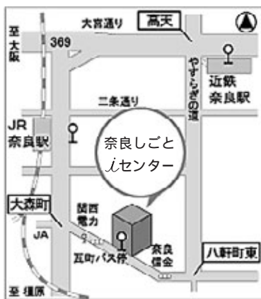
場所：奈良しごとiセンター (奈良市西木辻町93-6)