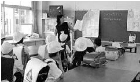
みんなで一緒に勉強

「家では一人でゲームばかりしている」、「塾や習い事で友だちと遊ぶ時間がない」、「もっとたくさんの友だちと遊びたい」、「自宅でなかなか宿題がはかどらない」、このような子どもたちの放課後の過ごし方を少しでも楽しく豊かにするために、小学校の放課後の教室を利用して「放課後子ども教室」を実施しています。遊びや学習だけでなく、家庭ではできないような新しい体験ができるよう、ボランティアのみなさんにも協力を得ながら工夫して行っています。