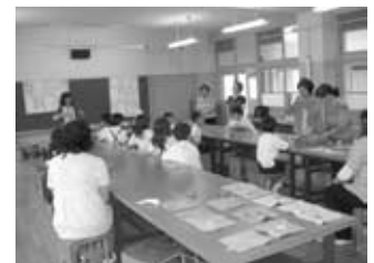
手芸や工作などの体験学習