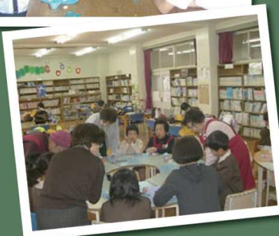
子どもたちと楽しく交流