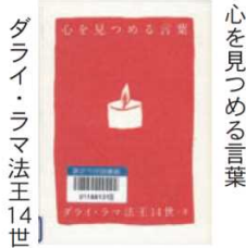
ダライ・ラマ法王 14 世