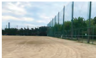
東大阪市立石切市民広場 大阪府東大阪市中石切町5-4-55 TEL.072-981-7764/080-4125-8921 [HP] https://www.hos-arena.com/hiroba/ishikiri/