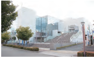
大阪市立住吉スポーツセンター・屋内プール 大阪府大阪市住吉区浅香1-8-15 TEL.06-6694-9201 [HP] https://hos-sumiyoshi.com