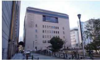
大阪市立阿倍野スポーツセンター 大阪府大阪市阿倍野区阿倍野筋3-10-1-100 TEL.06-6647-0086 [HP] https://hos-sumiyoshi.com/abeno/