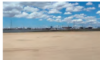
東大阪市立池島市民広場 大阪府東大阪市池島町4-4-10 TEL.072-988-2666/080-4125-8922 [HP] https://www.hos-arena.com/hiroba/ikeshima/