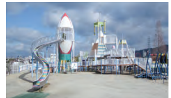
東大阪市花園中央公園 大阪府東大阪市松原南1-1-43 TEL.072-960-3426 [HP] https://hanazono-centralparks-hos.com