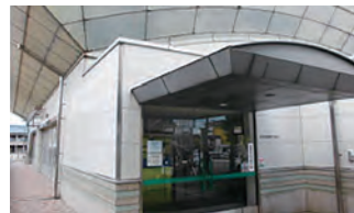
東大阪市立スポーツホールかがやき 大阪府東大阪市角田2-3-6 TEL.072-962-8811 [HP] https://www.hos-arena.com/kagayaki/