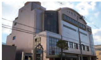
東大阪市立市民ふれあいホール 大阪府東大阪市鳥居町3-3 TEL.072-982-6563 [HP] http://www.hos-higashitaikukan.com/fureai/