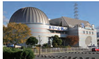
東大阪市立児童文化スポーツセンター(ドリーム21) 大阪府東大阪市松原南2-7-21 TEL.072-962-0211 [HP] https://www.dream21.higashiosaka.osaka.jp