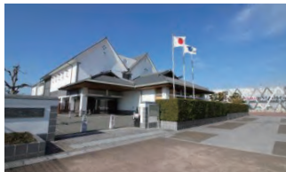
東大阪市民美術センター 大阪府東大阪市吉田6-7-22 TEL.072-964-1313 [HP] https://hos-higashiosaka-art.com