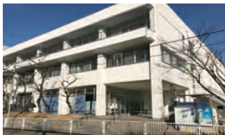
東大阪市立東体育館 大阪府東大阪市鷹殿町1-2 TEL.072-982-1381 [HP] http://hos-higashitaikukan.com