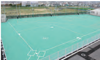
東大阪市立ウィルチェアスポーツコート 大阪府東大阪市松原南1-1-1 TEL.072-961-3668(花園ラグビー場) [HP] https://hanazono-wheelchair-hos.com