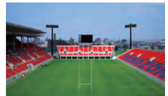
東大阪市花園ラグビー場 大阪府東大阪市松原南1-1-1 TEL.072-961-3668 [HP] https://hanazono-rugby-hos.com