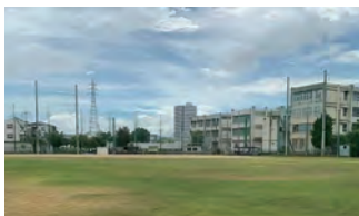
東大阪市立稲葉市民広場 大阪府東大阪市稲葉1-11-50 TEL.072-966-2533/080-4125-8792 [HP] https://www.hos-arena.com/hiroba/inaba/