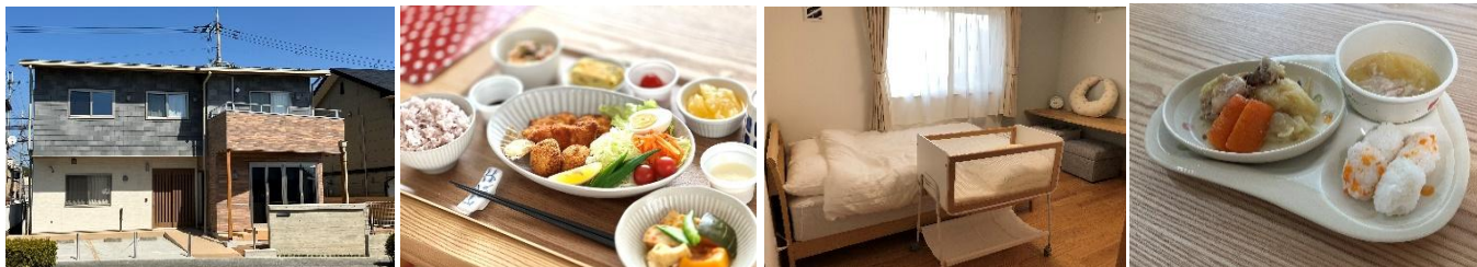
ご利用中の流れ(デイケア6時間の場合)

私たちは、親子の土台となるこのスタートの時期にしっかりと寄り添い、親子がゆっくり歩めるように、真心を込めてお手伝いをさせていただきたいと思っています。 ぽこあぽこのすぐ近くには、クリニックをはじめ「病児保育室 ぽっぽ」(香芝市補助事業)や、「木のおもちゃと絵本 Kikkireki」(香芝市地域子育て支援拠点事業(つどいの広場を含む))があり、助産師のほかにも医師・看護師・保育士・医療事務などの多職種が連携して、きめ細やかな関わりを大切にしています。 お食事は、お母さんと赤ちゃんのからだところに寄り添う家庭的なお料理でお迎えます。