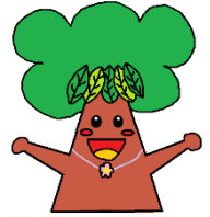
鎌小マスコットキャラクター くすのき