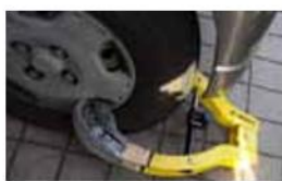
▲滞納者の自家用車を差し押さえる様子