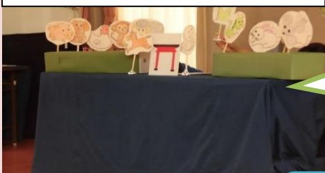
ペープサート「十二支のはじまり」

知っている動物が出てくると小さい子も「わんわん」「にゃん、にゃん」と言葉を発しながら指さしていました。