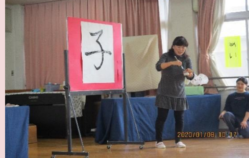
毎年恒例の所長先生による書き初め

知っている動物が出てくると小さい子も「わんわん」「にゃん、にゃん」と言葉を発しながら指さしていました。