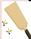
クラス対抗羽子板大会