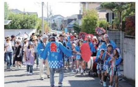
香芝・旭ヶ丘ニュータウン自治会