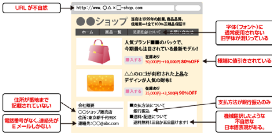
引用：消費者庁消費者政策課ホームページ