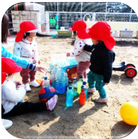
わなげ・ボーリング 友だちとルールを決めて遊んでいました 小さい子どもたちもきれいな色水の入ったペットボトルを運んでいました