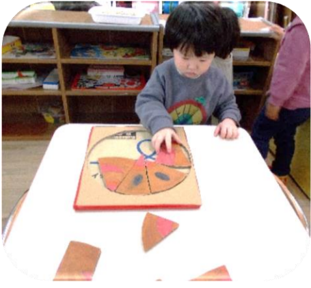
パズル アンパンマンは少し難しかったけど 繰り返し遊んでいました