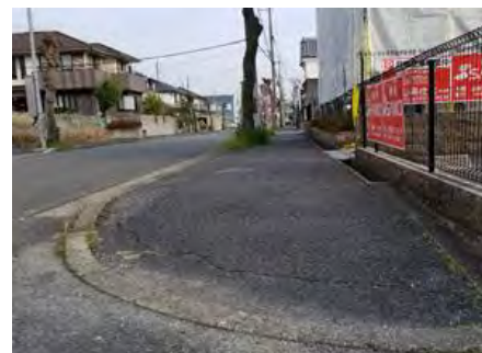
視覚障がい者誘導用ブロックが未整備（市道 8-102 号線）