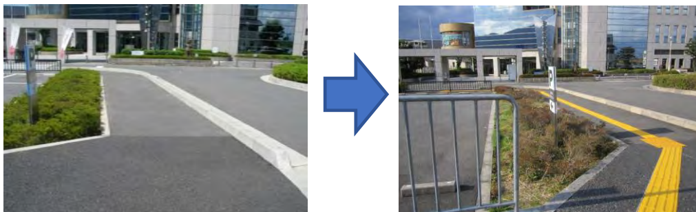
視覚障がい者誘導用ブロックの設置（市道 7-154 号線）