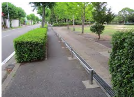
有効幅員が狭い歩道（市道 8-102 号線）