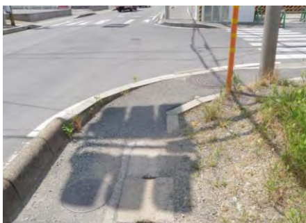
勾配がきつい歩道（国道168号）

※2 グレーチング・段差を視覚障がい者誘導用ブロックの誘導で避けることで対応する。