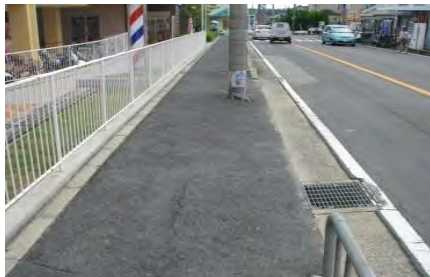
路面が傾いている歩道（市道9-187号線）