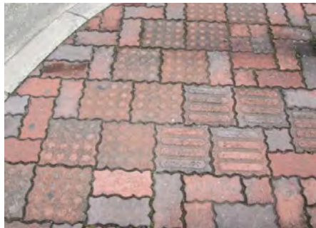
識別しにくい視覚障がい者誘導用ブロック