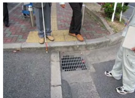
段差と目の粗いグレーチング（国道168号）