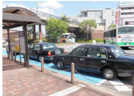
タクシー乗り場（駅前広場）