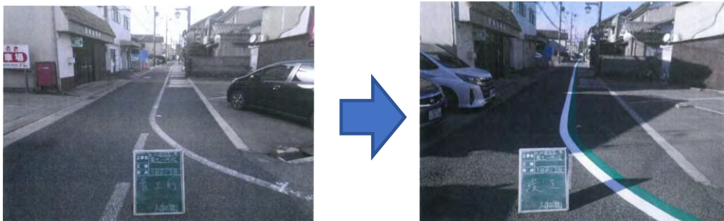
歩行者スペースの明示など（市道6-46号線）