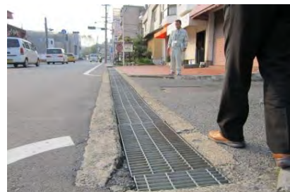
目の粗いグレーチング（市道9-187号線）