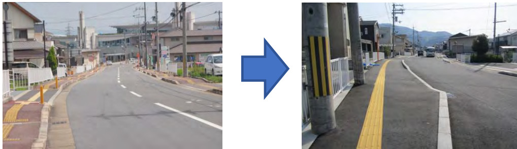
波打ちがある歩道（市道 7-131 号線）