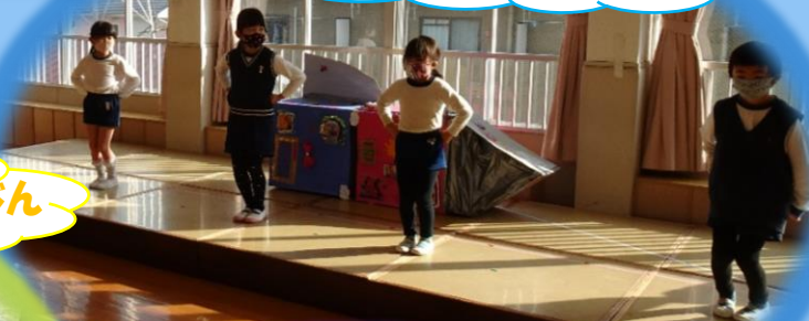
ダンスのすきなうちゅうじん