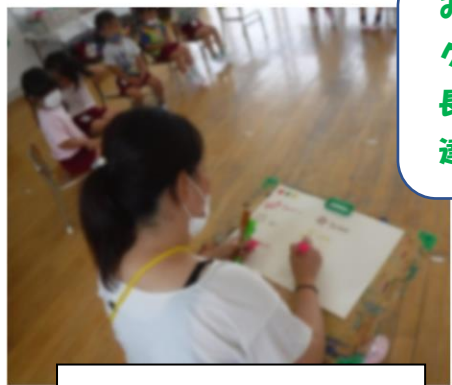
あいすくりーむチーム

みんなで色々な意見を出して グループ名が決まりました。年 長児を中心に意見を言えて、友 達の話もしっかり聞けました。