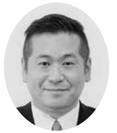
芦高 清友 議員