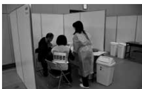
新型コロナウイルスワクチン接種予行演習の様子

〔福祉健康部長〕 地域での集団接種場所の確保は市民の利便性を考えると必要と考えるが、ワクチンを管理する冷凍庫等の設備が必要になるため、まずは保健センターと総合体育館での集団接種を考えている。