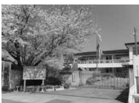
認定こども園鎌田幼稚園

(答) 「教育部次長」説明会を複数回実施する、通知文を送付する等、各施設やPTAとも相談しつつ説明方法を決定していく。