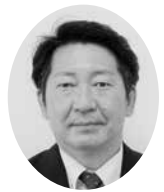
中谷 一輝 議員