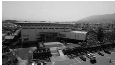
香芝市総合体育館

身体障がい者用スロープの設置工事をやっており、令和3年3月中旬に工事完了の予定である。