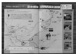
大奈ウォーク 公式ガイドマップ

〔問〕 日本遺産等について様々な調査をされているが、郷土資料を積極的に調査する組織を新たに立ち上げてはどうか。