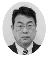
筒井 寛 議員