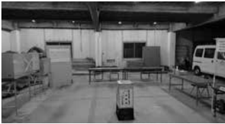
臨時期日前投票所