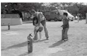
防災訓練のようす

(問) 高齢者や体の不自由な方々を対象にしたふれあい収集の認定方法についてお聞きしたい。