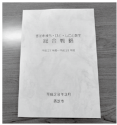
まち・ひと・しごと創生総合戦略

をいただき、その他にも総合戦略に位置づけられている事業に対する交付金の活用が可能となっており、補助率は事業種別によって変わってくる。人的支援では、地方創生人材派遣制度により、本市も総務省から派遣していただいている。