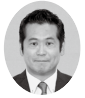
芦高 清友 議員