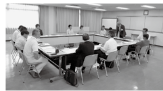
働き方改革推進協議会

平成31年2月に業務改善方針を作成した。また6月に働き方改革推進協議会を設置し、業務改善方針を柱として環境整備、校務見直し、地域連携の3部会を編制して改善を進めていきたいと考えている。