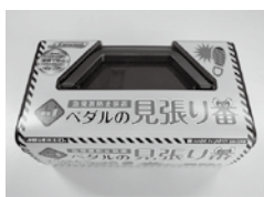
踏み間違い防止装置

〔問〕事故の原因の多くがブレーキとアクセルの踏み間違いであり、踏み間違いを防ぐ装置の購入費に対する補助は考えていないのか。