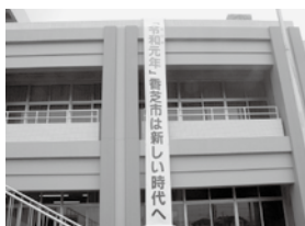
令和を祝う懸垂幕

〔企画部長〕カッシーとの記念撮影や婚姻届、出生届を提出された方に改元日限定のメッセー