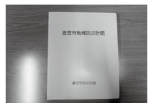
香芝市地域防災計画

〔危機管理監〕 配布している2つのマニュアル以外に、もう少しわかりやすい資料を作り説明会を実施するなど前向きに検討したい。