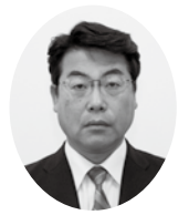
筒井 寛 議員