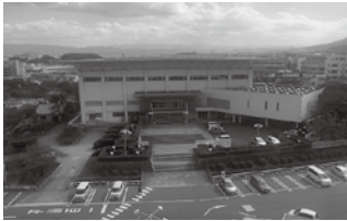
改修予定の総合体育館