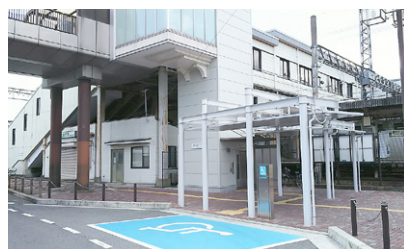
近鉄五位堂駅の身障者用乗降場

鉄五位堂駅のエレベーターや障がい者用乗降場、点字誘導ブロックの設置などを整備している。