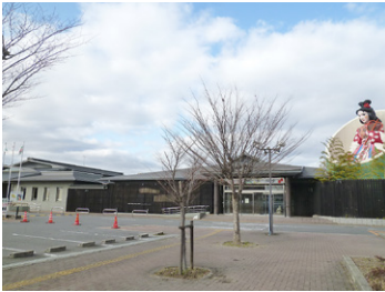
香芝市民も利用しやすくなるはしお元気村

(答) 広陵町の施設では、広陵町パークゴルフ場とはしお元気村の施設使用料が、広陵町民と同額で香芝市民も利用することができるようになる。