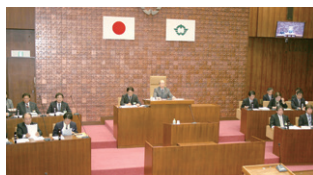
12月定例会のようす