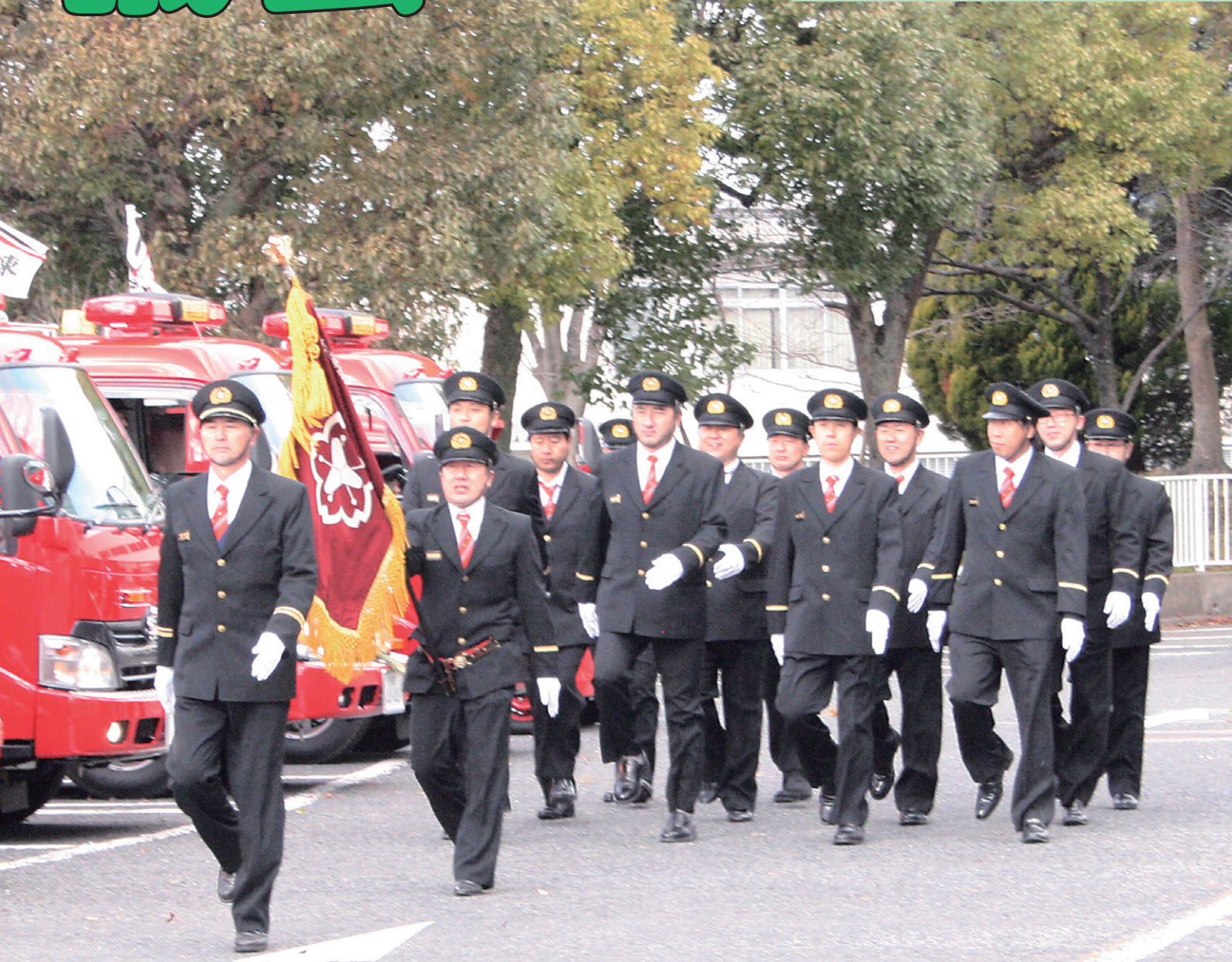
平成29年消防出初式 分列行進(1月14日)