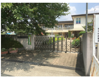
認定子ども園となる鎌田幼稚園

〔福祉健康部長〕今年度から子どもの医療費助成を中学卒業まで拡大や、小児B型肝炎のワクチン接種などを行っている。