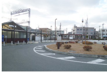
整備された近鉄下田駅前広場

〔都市創造部次長〕香芝駅と近鉄下田駅を含む地区を本市の顔として位置づけているが、整備計画の策定はしていない。