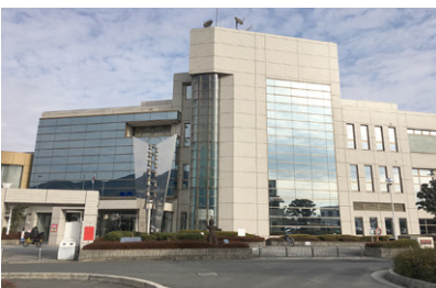
引き続き指定管理となる香芝市ふたかみ文化センター