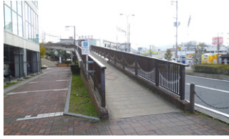
補修を予定している近鉄五位堂駅北側のスロープ

〔都市創造部長〕駅前広場のロータリー工事に先立って、スロープ表面の滑り止め補強を考えている。