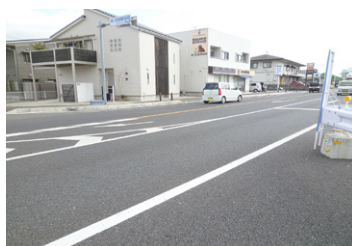
4車線化を予定している国道168号線

号線と168号線の4車線化が今後のまちづくりに影響してくると考えており、それらを踏まえた経済効果などを、新たに策定する都市計画マスタープランに盛り込んでいく必要があると考えている。