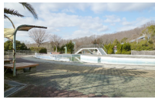
香芝市総合プール

〔都市創造部次長〕プールの廃止後は、どんづる峯地区と一体となった自然を生かした公園として整備をする予定である。