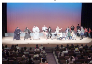
昨年の「相撲発祥の地」宣言まつり