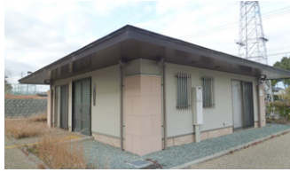
市営住宅の集会所

〔総務部理事〕集会所が利用しやすくなるように、要綱などを整理していきたいと考えている。