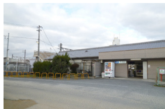
バリアフリー化の要望があるJR香芝駅

〔都市創造部長〕県全体の総合力を発揮する都市形成を目指した連携に向けて、県と協議を行っている。