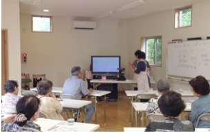
口腔機能低下予防教室

〔問〕介護のアンケートを実施したのは、どのような理由なのか。 〔健康局長〕第7期の介護保険事業計画の基礎資料とするため、対象者は65歳以上の市民である。