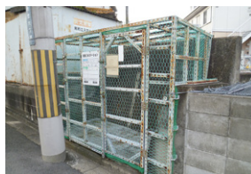
カラスによる被害を防ぐためのネット

(問) カラスによるゴミステーションの被害は把握しているのか。 〔市民環境部長〕 ゴミステーションではゴミの散乱被害が一番多く、ゴミの出し方などマナー啓発を考えている。