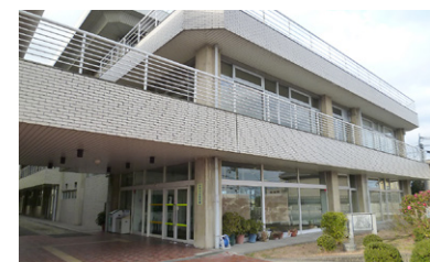
指定管理となる中央公民館

〔問〕今回の組織改革について、その効果や検証などは今後どのように検討していくのか。