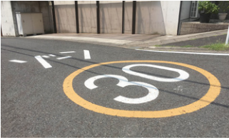
危険箇所に標示されているゾーン30