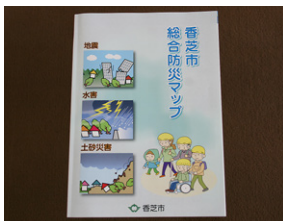
危険区域が記されている香芝市総合防災マップ

〔都市創造部長〕該当する地元自治会には事前説明を行っており、県や市のホームページなどで周知している。