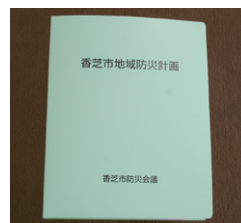
示した災害時の対応地域防災計画