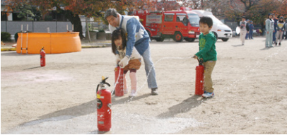
市内で行われた防災訓練の様子

〔問〕過去に締結した災害協定の内容について、再確認は行っているのか。 〔危機管理監〕一部の団体とは訓練等を通じて確認を行っている。