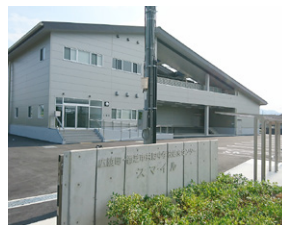
広陵町との合同給食センター