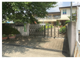
五位堂保育所分園が設置されている鎌田幼稚園

〔福祉健康部長〕社会情勢によって入所希望者も増える可能性はあるが、待機児童ゼロを目指して事業を進めていきたい。