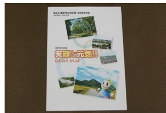
香芝市総合計画後期基本計画書