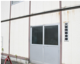
備蓄品が保管されている災害備蓄倉庫

〔危機管理監〕そのために自主防災組織活動事業費補助金要綱により、経費の一部の補助を行っている。