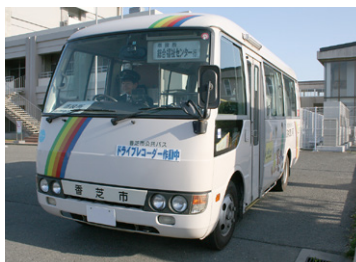
コミュニティバスとして運行を予定している公共バス

(問) コミュニティバスの料金について、障がい者や70歳以上の方の料金を無料にできないのか。また、ルート