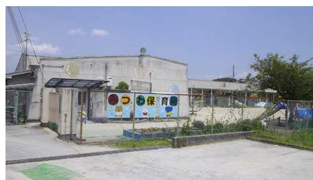
建替えが行われるみつわ保育所

（答） 進入道路については、再度、隣接の土地所有者に話をして、道路の拡幅ができるようにしたいと考えており、9月議会にはその結果を報告したい。