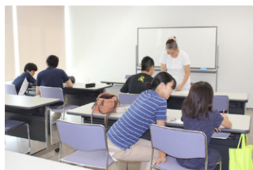
心と学びのサポート事業の様子

〔福祉健康部次長〕施策は必要と考えており、今後の支援体制などを検討しているところである。