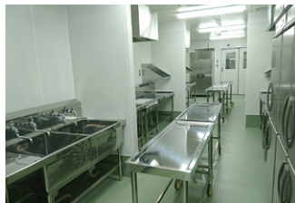
給食センターに設けられたアレルギーマスク対応室

(教育長) 保護者から学校生活管理指導表を提出してもらい、アレルギーマスクの対応について面談している。