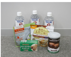
災害時のために備蓄された食料品

〔問〕災害時の非常用電源の確保については、どのように考えているのか。 〔危機管理監〕香芝北中学校には自家発電機能を備えているが、その他の避難所にはないので、今後、検討