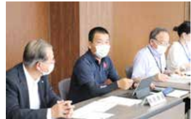
実行委員会の様子。 奈良テレビの取材も受けました！