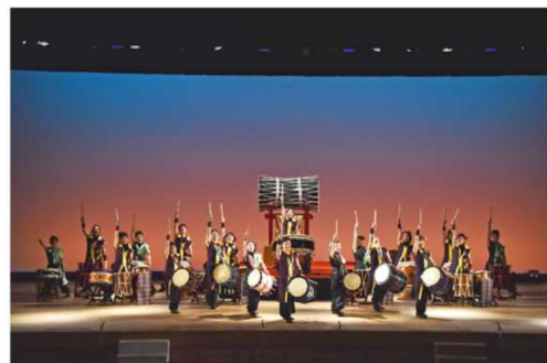
香芝天衝太鼓の演技の様子