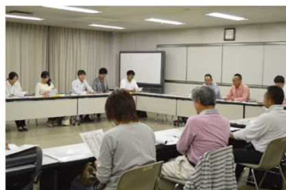
9月30日(水)の会議の様子。熱い議論が交わされました。

「これまで無我夢中で走り続けてきたので、あつと言う間に時間が過ぎました。実行委員の先輩や後輩からさまざまなことを教えてもらい、そして、支え合うことで自分も実行委員のメンバーも成長してこれたと思います。周りの皆さんの協力があつたからこそです。そして、冬彩も私たちとともに育ってきたと思います。今の目標は20周年を目指し、これからも成長をしていくことです。そして、世代が変わっても変わらず続いてほしいですね」と熱い思いを語っていただきました。