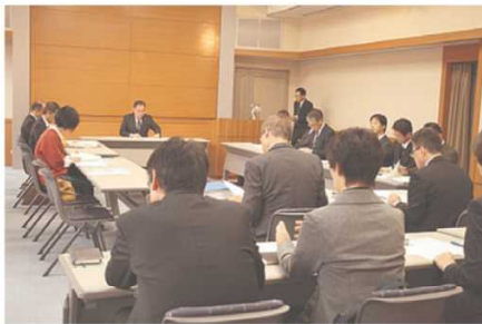
運営委員会の様子