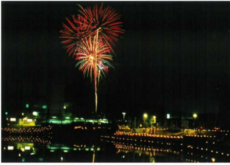
第1回目（平成13年）は、2,500本のロウソクに灯がともりました。

は産声をあげました。ただ華やかで楽しいだけの行事ではなく、何か人の心を温め、人と人が緩やかにつながる、そして古都奈良の香芝らしさを感じられる市民行事にしたという思いから、冬彩実行委員会が組織されました。市民が中心となって企画案作りからスタートし、何度も会議を重ね、手作りで進められました。そうして何もないところから、市民自らの手で温め