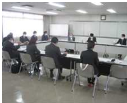
【知見者と教育委員会事務局職員との懇談会】