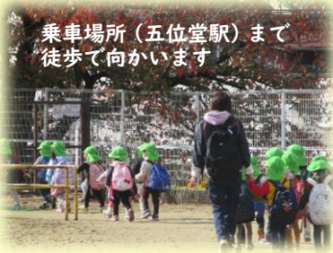
乗車場所(五位堂駅)まで 徒歩で向かいます