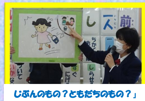
「じぶんのもの？ともだちのもの？」