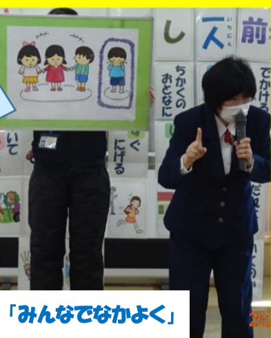
「みんなでなかよく」

「叩いていいの？」「自分のもの？友達のもの？」「みんなで仲良く」の絵カードを見ながら「この絵は、何をしているところかな？」「友達を叩いてもいいかな？」「友達が使っているおもちゃをとってもいいかな？」など子どもたちに投げかけていただきました。各クラスで「どんな気持ちするかな？」「こんな時は、どうしたらいいのかな？」など子どもと一緒に考えながら学び合いました。