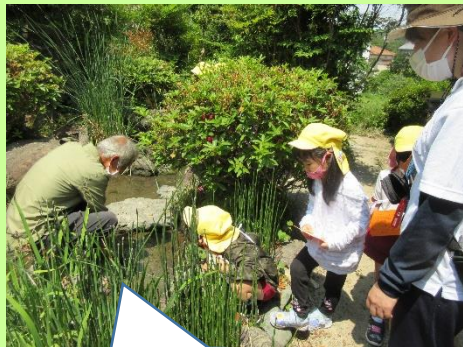
この池にはクロメダカがいるんだよ