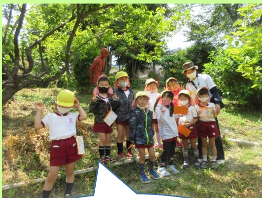
おもしろい人形の前で