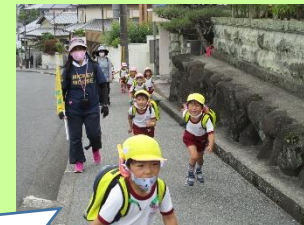
帰り道。幼稚園までの最後の登り坂、頑張ろう!