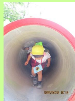
リュックを背負って幼稚園を探検しますよ~