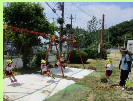
探検したところをおもちゃのカメラで撮るよ~