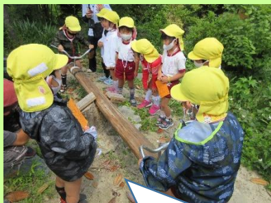
シーソーでも遊んだよ