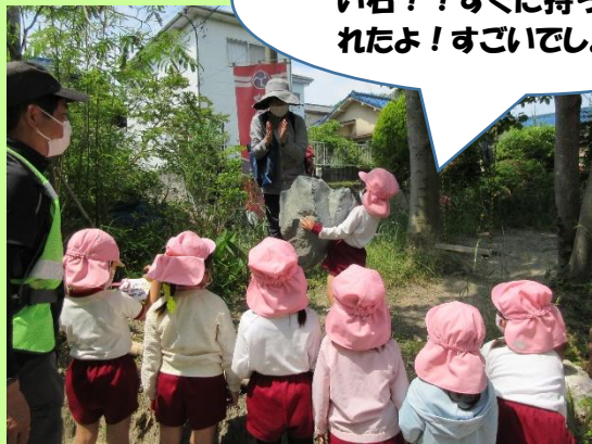
大きいけれどもとっても軽い石!!すぐに持ち上げられたよ!すごいでしょ!!