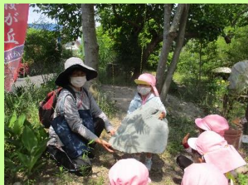
おおきなフランクもあったよ