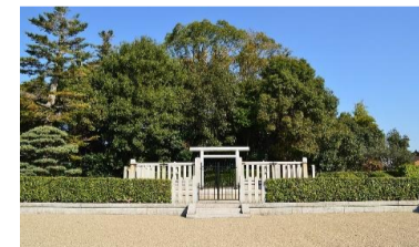
これは何でしょうか?

藤山方面、北今市方面、逢坂方面、下田方面、5月20日より、4回に分けて、校区内を歩きました。それぞれの地域に、どんなお店があるのか、どんな建物があるのかを調べるためです。