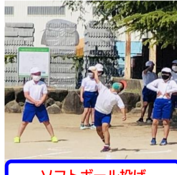
ソフトボール投げ