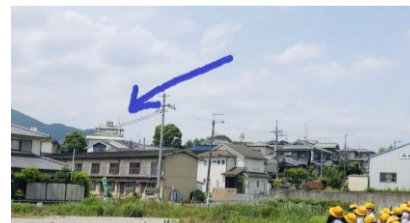
あっ、学校が見えるで~!