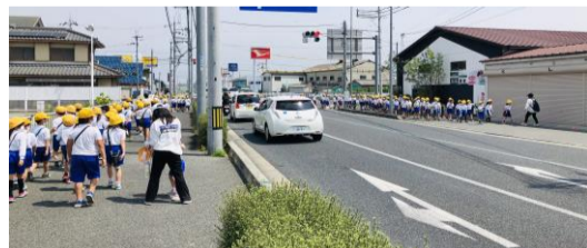
ここでUターンしました