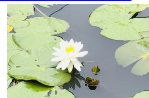
前栽の池に咲く蓮の花です