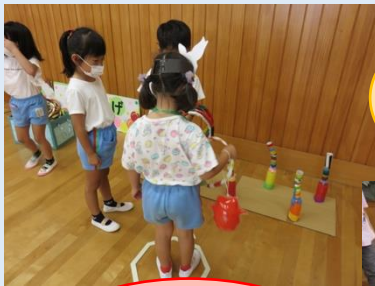
ボーリングコーナー