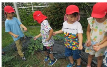
網をかけて・・・