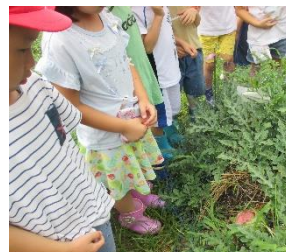
怒りを越して言葉が出ない子どもたちでした