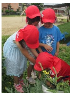
柱を立てて・・・