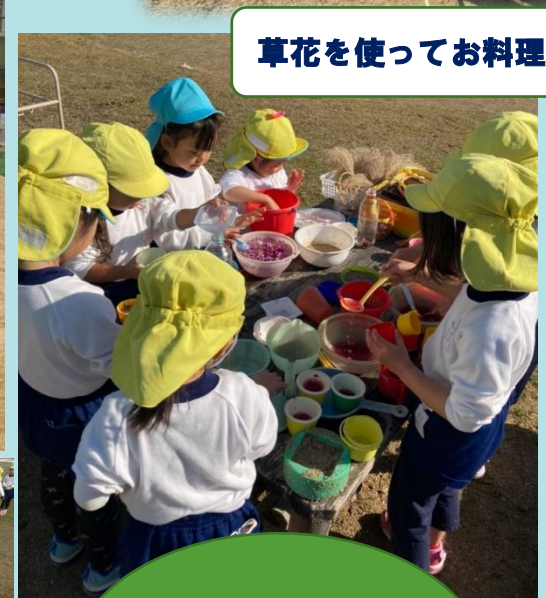
草花を使ってお料理