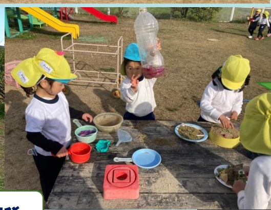
いらっしゃいませ～ ジュースはいかかです か??