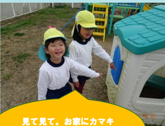
見て見て。お家にカマキ リの卵がついている！！