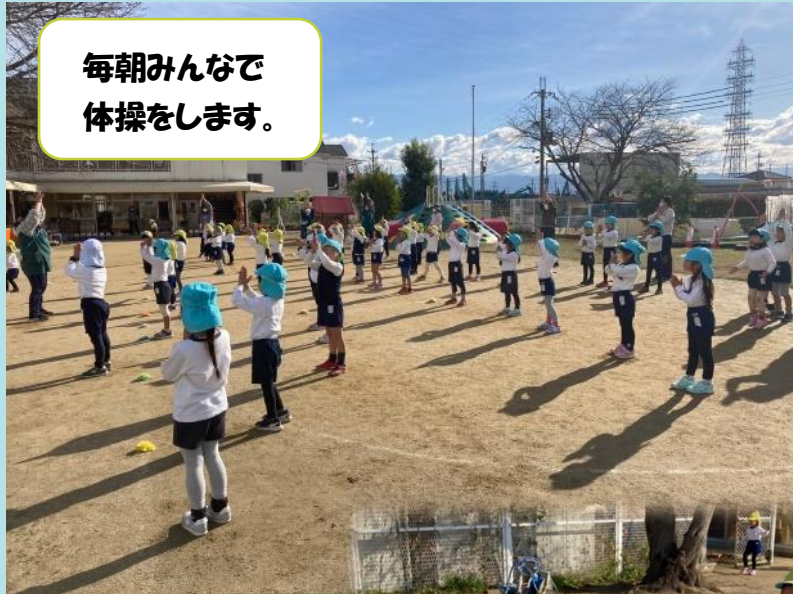
毎朝みんなで 体操をします。