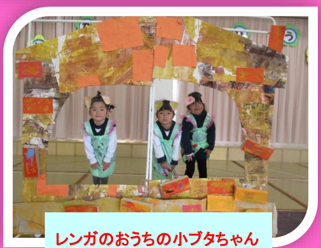
レンガのおうちの 小ブタちゃん