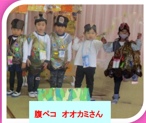
腹ペコ オオカミさん