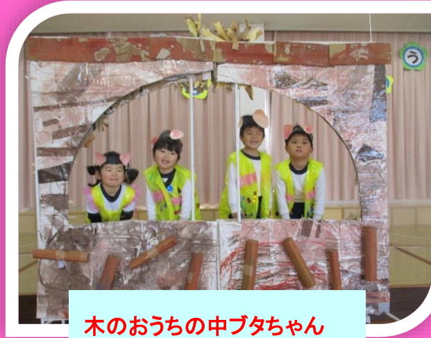
木のおうちの 中ブタちゃん

はな組さんにとってたくさんの観客の前での発表会はきっと緊張することと思います。 子どもたちの一生懸命頑張る姿を温かく見守っていただきたくさんの拍手をよろしくお祈りします。