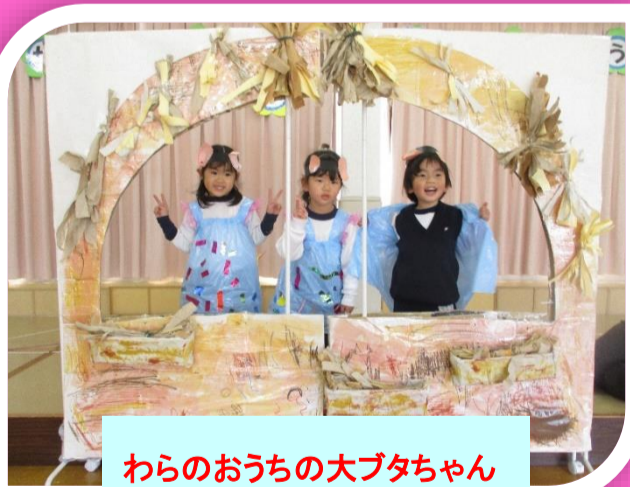
わらのおうちの大ブタちゃん