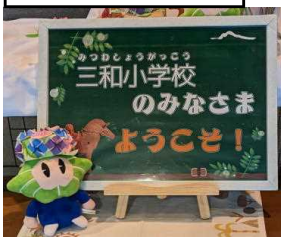
二上山博物館の入り口に...