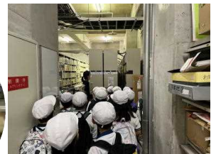
二上山博物館の内側も見せていただきました