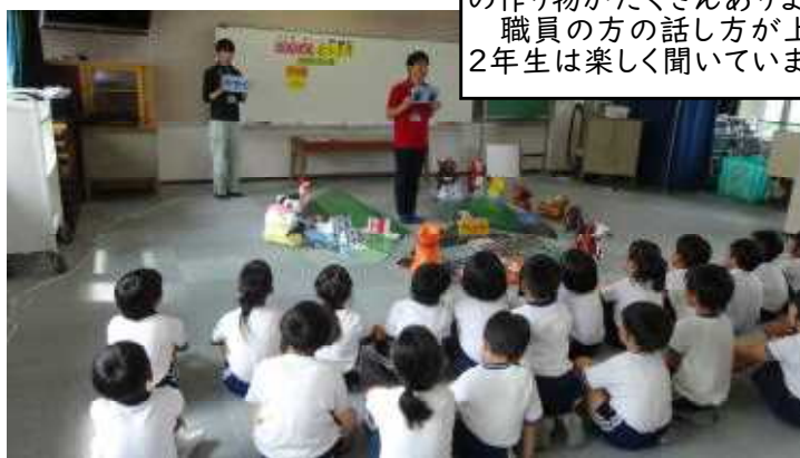
子どもたちに分かるよう、動物の作り物がたくさんありました。職員の方の話方が上手で2年生は楽しく聞いていました。