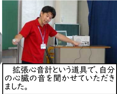
拡張心音計という道具で、自分の心臓の音を聞かせていただきました。